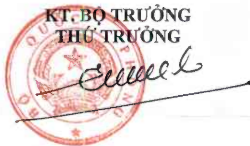
Thượng tướng Nguyễn Tân Cương